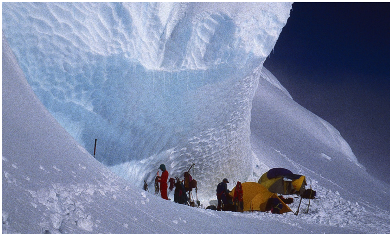
Auf dem Rhonegletscher sollte es etwas flacher sein...